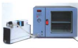
Vacuum Oven capacity에 따른 펌프 선택 예시

Vacuum Oven < 15lit cap Vacuum Oven < 15~30 lit cap Vacuum Oven < 30 lit cap