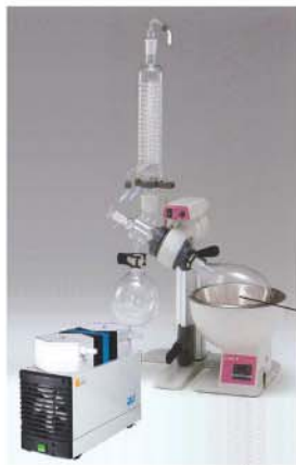
Evaporation Flask에 따른 펌프 선택 예시