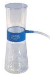
5L 이상 flask

N811KN.18 11.5L/min, 240 mbar N811KT.18(내화학성) 11.5 L/min, 290 mbar